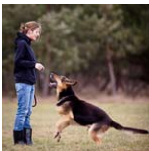
Formation des propriétaires de chiens

Au niveau fédéral, cette obligation est également devenue légale depuis le 1er janvier 2007. Cette mesure vise à faciliter les enquêtes menées suite à des accidents par morsures, à des cas d'épizooties ou lorsque des animaux se sont échappés, ont été maltraités ou abandonnés.